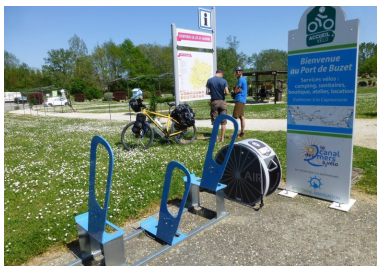
station de gonflage au port de Buzet (47) au bord de la véloroute du canal des 2 mers

Ci-après, quelques exemples d'aménagements, plus d'infos sur https://www.velo-territoires.org/wp-content/uploads/2018/09/FICHE-ACTION-8_quipements-et-aires-darrt_VF.pdf