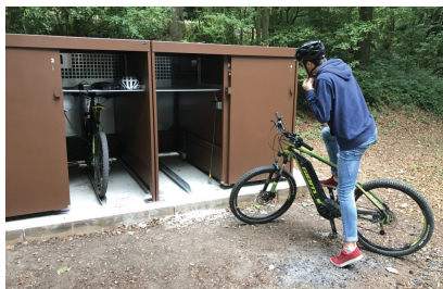
box et abris sécurisés pour sacoches au parc d'Orlain (62)