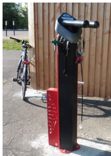
borne d'auto réparation au musée d'Alésia (21)