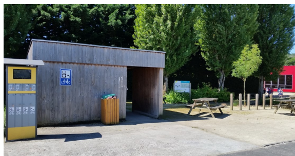
parc à vélo couvert, consignes, tables, bancs, poubelle à Montjean-sur-Loire (49)