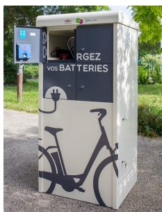
borne de recharge VAE à Siémi (49)