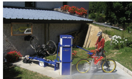
atelier d'auto réparation à Arcanson (38)